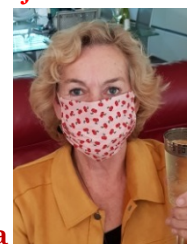
_____ kilometer Thea