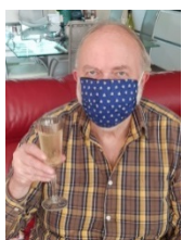
Paul _____ 1,5